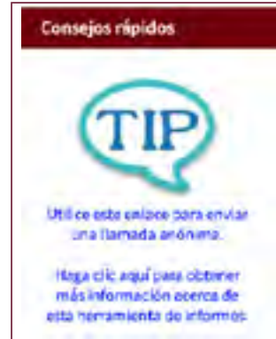
Imagen de el enlace de Consejos rápidos en el sitio web

Los consejos pueden ser anónimos, o puedes provenir la información de contacto. Se puede usar Consejos rápidos también, para archivar una queja de DASA, en que en este caso la información de contacto es obligatoria.